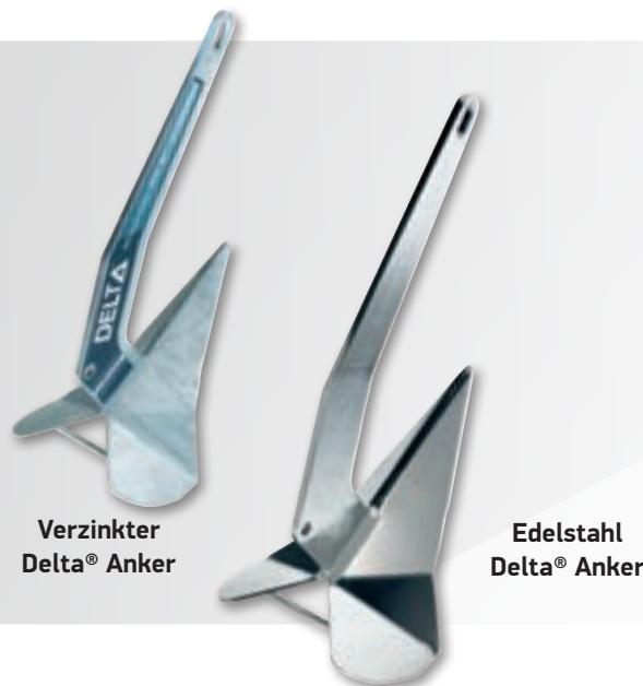
Verzinkter Delta® Anker

Konstant und zuverlässig leistungsfähig besitzt der Delta® Anker eine lebenslange Garantie gegen Materialbruch 1 , besitzt ein Lloyd´s Prüfungszeugnis ** als Anker mit höchster Haltekraft und ist die erste Wahl für Anker auch zahllosen Rettungsbooten der National Lifeboat Organisation.